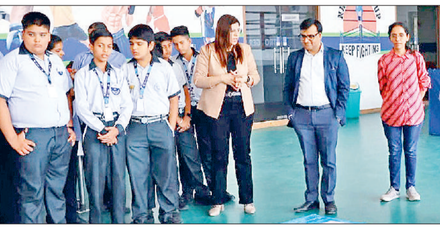
राई। क्रिएटिविटी लीग में प्रतिभाग करते विद्यार्थी।

स्वर्णप्रस्थ पब्लिक स्कूल में युवाओं के नवीन अनुसंधान, रचनात्मकता और भविष्य निर्माण की सकारात्मक सोच को नई दिशा एवं दशा देने के उद्देश्य से क्रिएटिविटी लीग के प्रथम चरण का आयोजन किया गया। हरियाणा और पंजाब राज्य के विविध विद्यालयों से लगभग 300 से अधिक छात्रों ने अपनी दूरदर्शी परियोजनाओं का प्रदर्शन विभिन्न श्रेणियों में किया, जिनमें से निर्माण विभाग द्वारा निर्धारित मानकों के आधार पर सफल प्रतिभागी अगले दौर में प्रवेश क्रिएटिविटी साहू द्वारा संचालित अखिल भारतीय प्रतिष्ठित