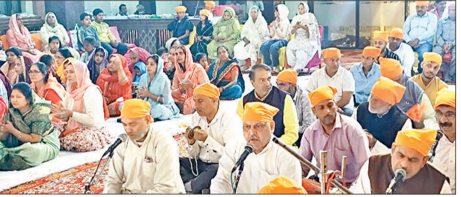
सोनीपत। अग्रवाल धर्मशाला में कार्यक्रम के दौरान मौजूद श्रद्धालुगण।