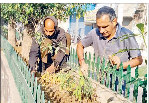
गोहाना। पुराने पौधों की देखभाल करते संगठन के सदस्य।

कंपोस्ट और वर्मी कम्पोस्ट जैसे विकल्प अपनाने के लिए प्रेरित किया गया। कार्यक्रम के अंत में ग्रामीणों ने पराली न जलाने और पर्यावरण संरक्षण का संकल्प लिया।