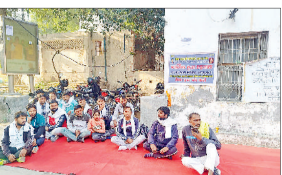
सोनीपत। नगर निगम में धरने पर बैठे सफाई कर्मचारी।

ठेका सफाई कर्मचारी एकता मंच संबंधित मूलनिवासी कर्मचारी कल्याण महसंघ सहयोग बली सेना सोनीपत युनियन का धरना रविवार को 39 वें दिन भी जारी रहा। इस दौरान लगातार नौवें दिन भूख हड़ताल भी की गई। भूख हड़ताल पर बैठे सफाई कर्मचारियों ने आरोप लगाया कि शासन व प्रसासन हटाए हुए कर्मचारियों की कोई भी सुध नहीं ले रहा है और ना ही हरियाणा सरकार द्वारा जारी पत्र पर कोई