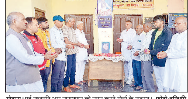
गोहाना। पूर्व राष्ट्रपति आर नारायणन को नमन करते मोर्चे के सदस्य।