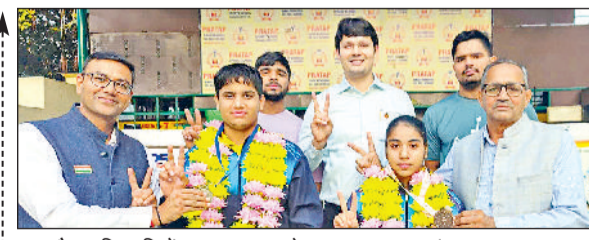
खरखौदा। खिलाड़ियों का स्वागत करते हुए प्रताप स्कूल प्रबंधन।