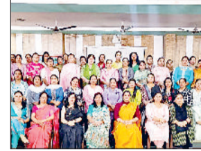
सोनीपत। कार्यशाला में शामिल प्रतिभागी एवं स्कूल स्टाफ।